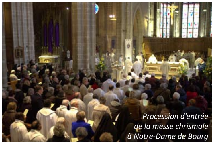
Procession d'entrée de la messe chrismale à Notre-Dame de Bourg

L'organisation paroissiale, telle que nous l'avons connue, a porté du fruit durant de nombreux siècles, notamment parce qu'elle