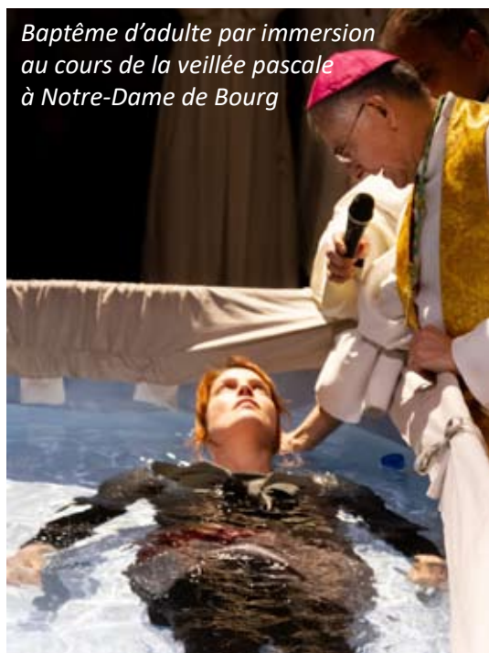
Baptême d'adulte par immersion au cours de la veillée pascale à Notre-Dame de Bourg

Message pour la Semaine Sainte diffusé sur RCF le 19 avril 2019