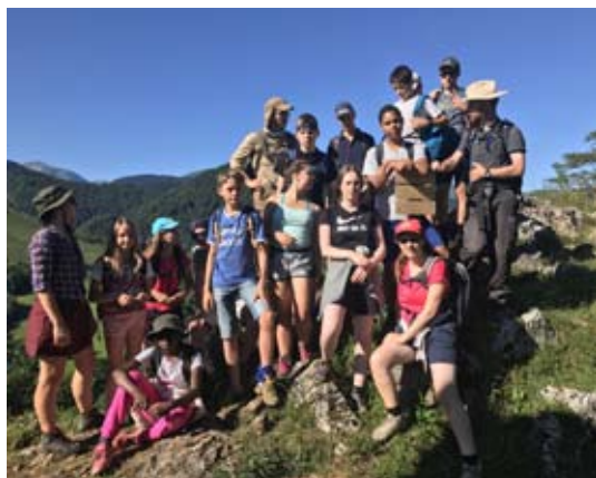
10 • EPA Mai 2019

Acompte de 50 € pour valider l'inscription auprès de la Pastorale des Jeunes.